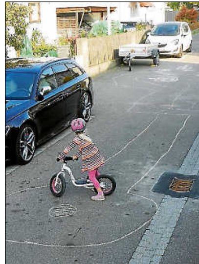
Kinder erobern sich die Teckstraße zurück.

Durch Corona sind in den letzten Monaten viel mehr Bürger*innen zu Fuß und mit dem Fahrrad im und um den Ort unterwegs gewesen. Dies war sehr schön anzusehen. Manche haben dadurch Orte und Wege kennengelernt, die sie so vorher nicht konnten. Nun hat am 1. Juli das Stadtradeln begonnen. Das Stadtradeln hat zum Ziel, möglichst viele Alltagswege umweltfreundlich mit dem Fahrrad zurückzulegen. Wer dies wettbewerbsmäßig betreiben will, kann sich bei www.stadtradeln.de/pleidelsheim registrieren.