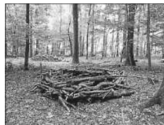
Der fertige Kobel

Und einen solchen Kobel haben die Wurzelkinder diese Woche zum Start des neuen Themas "Eichhörnchen" gebaut. Sehr fleißig waren sie und am Ende dann sehr stolz.