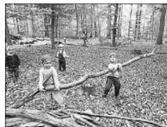
Fleißige Waldarbeiter