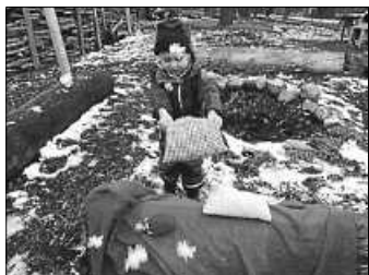
Frau Holles Helfer