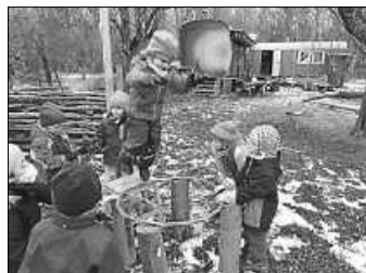
Kopfüber in den Brunnen